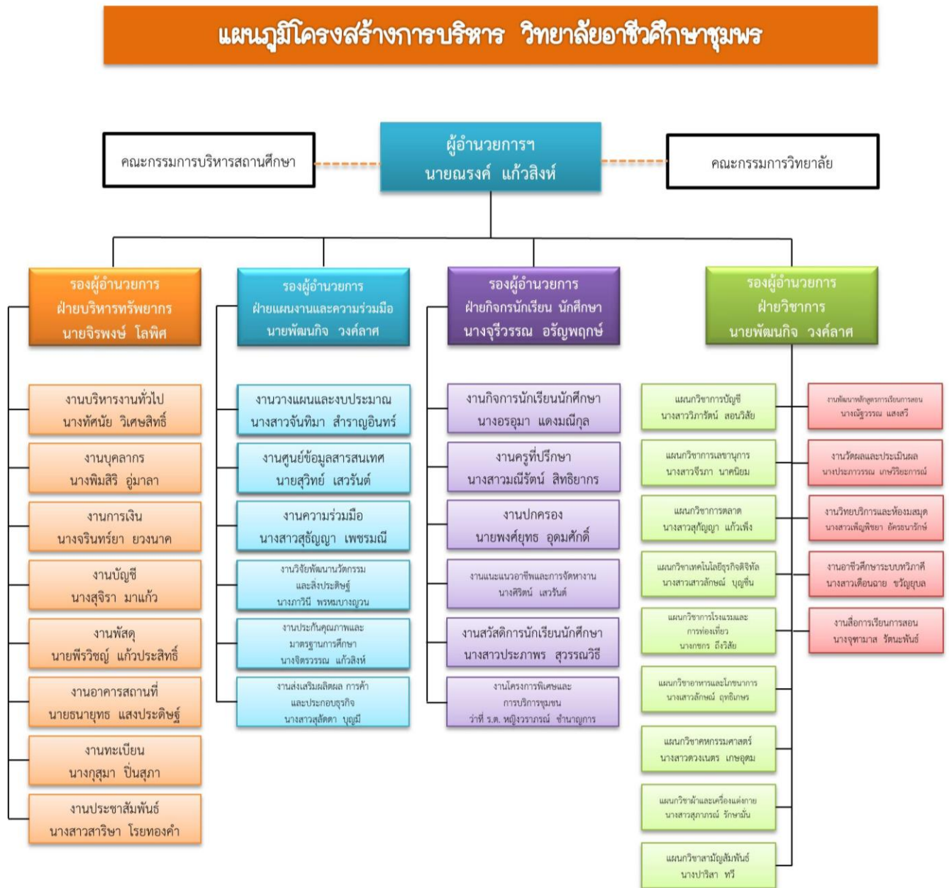
รูปที่ 2.1 แผนภูมิการบริหารของสถานศึกษา